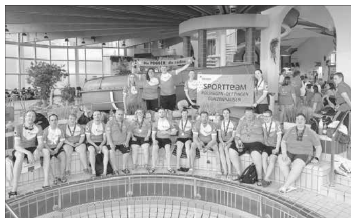
Das Bild zeigt die erfolgreiche Mann- und Frauschaft

Die perfekte Generalprobe war dabei das Kurzstrecken-Schwimmfest in Hof von Special Olympics Bayern.