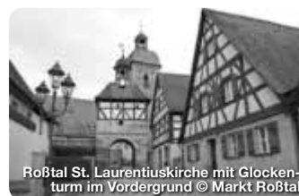
Roßtal St. Laurentiuskirche mit Glockenturm im Vordergrund

Wer an Stein denkt, dem fällt wohl zuerst Faber-Castell ein oder die B14 oder beides. Dabei hat die Stadt, die zwar am südwestlichen Rand Nürnbergs am linken Ufer der Rednitz liegt, aber zum Landkreis Fürth gehört, viel, viel mehr zu bieten. TreffpunktDeutschland.de/rosstal