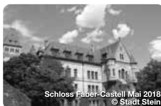
Schloss Faber-Castell Mai 2018

Ehem. Augustiner Chorherrenstift Das Kloster wurde 1409 von den Burggrafen von Nürnberg Johann III. und Friedrich VI. gestiftet. Zerstörung im Jahre 1460. Wiederaufbau bis 1468. Prinzregentenplatz 2, Langenzenn