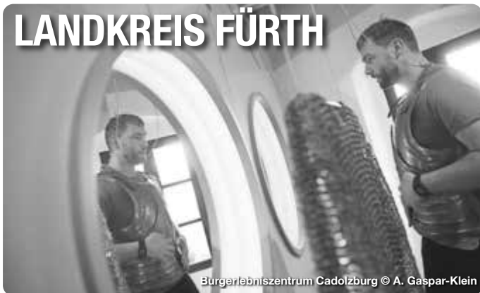
Bürgerlebenszentrum Cadolzburg

Alle Termine und Angaben unter Vorbehalt!