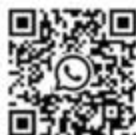
QR-Code für den Beitritt zur WhatsApp Gruppe der Krabbelgruppe Ursheim

Ab sofort treffen wir uns jeden Mittwoch von 9:30 - 11:00 Uhr zum Singen, Spielen, Lachen im Gemeindehaus in Ursheim. Bei Interesse könnt ihr gerne unter folgendem QR-Code unserer WhatsApp Gruppe beitreten. Dort folgen noch nähere Informationen.