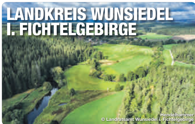
Hendelhammer © Landratsamt Wunsiedel i. Fichtelgebirge

Alle Termine und Angaben unter Vorbehalt!