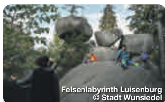
Felsenlabyrinth Luisenburg