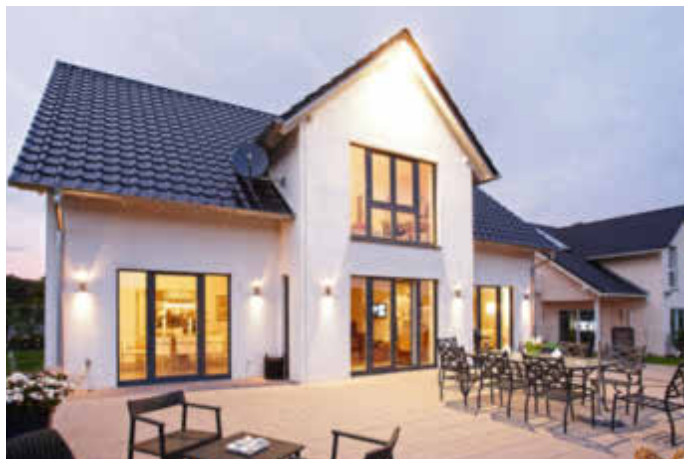
Auf den ersten Eindruck kommt es an: Eine strahlend weiße Fassade ist die Visitenkarte des Eigenheims.

(DJD). Die Fassade ist nicht nur die Visitenkarte des Zuhauses, sondern bildet gleichzeitig die schützende Hülle für die Bausubstanz. Wind, Wetter und die UV-Strahlung der Sonne nagen mit der Zeit an den Außenwänden. Hinzu kommen oft Feuchtigkeitsprobleme. Bäume, Sträucher oder Gewässer in Fassadennähe schaffen ein geeignetes Klima für Moos und Algen. Die Pflanzen werfen Schatten und hindern so die Sonne daran, Kondenswasser oder Regentropfen zu trocknen. Wenn sich grün-graue Ablagerungen ausbreiten oder die Farbschicht abzublatern beginnt, wird es höchste Zeit für eine umfassende Sanierung.