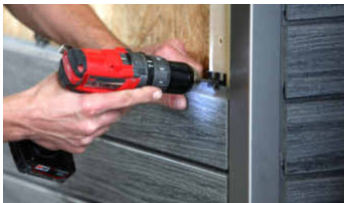
Fassadenprofile werden mit einer Nut- und Spundverbindung formschlüssig auf einer Holzunterkonstruktion angebracht.

Eine Alternative zu Holz, Klinker und Putz sind Profile aus Holzverbundwerkstoffen, die als vorgehängte hinterlüftete Fassade verwendet werden. Solche Leisten werden anhand einer Nut- und Spundverbindung formschlüssig und mithilfe von Montageklammern auf einer Holzunterkonstruktion verlegt. Dadurch entsteht eine plane Oberfläche. Praktisch ist es, wenn die neuen Fassadenelemente einen rhombischen Querschnitt haben. Das heißt, dass die Oberseiten und die Unterseiten so geneigt sind, dass Regenwasser schnell ablaufen kann. Das reduziert die Schimmelbildungsgefahr. Mit Holzverbundwerkstoffen ist man längst nicht nur auf die reine Holzoptik reduziert. „Die Gestaltende“ von Naturinform beispielsweise bietet neben einer natürlichen mehrfarbigen Holzmaserung auch Profile mit einer geprägten Linienstruktur. Sie sind in verschiedenen Breiten erhältlich und können sowohl waagrecht als auch senkrecht sowie in Kombination verlegt werden.