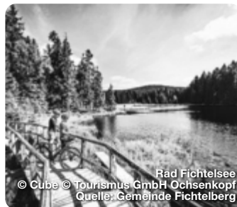
Rad Fichtelsee © Cube © Tourismus GmbH Ochsenkopf Quelle: Gemeinde Fichtelberg

großen Nachbarn der Metropolregion verstecken. Die hübsche historische Altstadt mit vielfältigen Shopping-Möglichkeiten, das Neue Schloss mit dem Hofgarten und, etwas außerhalb, die Eremitage sind Zeugnisse einer schillernden Vergangenheit. TreffpunktDeutschland.de/bayreuth