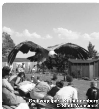
Greifvogelpark Katharinenberg