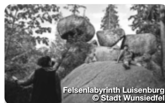
Felsenlabyrinth Luisenburg