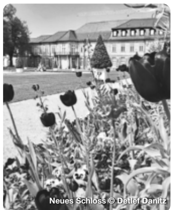
Neues Schloss